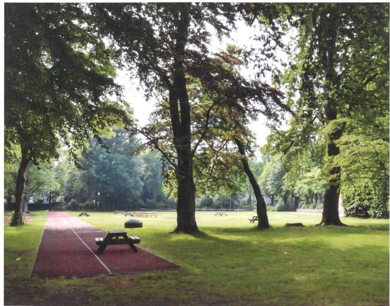
Der ehemalige Garten Emden in Hamburg heute, entworfen von Leberecht Migge.