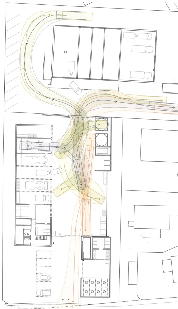
Werkhof Matzingen: EG mit eingezeichnetem Schleppkurvenkonzept. Mst. 1:600.

Das Siegerprojekt «tsiagalhüta» überzeugt die Jury «neben den gut gelösten Funktionsabläufen insbesondere durch die Angemessenheit der Mittel in ortsbaulicher und gestalterischer Hinsicht sowie die sorgfältige konstruktive Ausarbeitung». Den Verfassern gelingt es, das verborgene Potenzial dieser einfachen Aufgabe mit grosser Sicherheit auszuloten und daraus ein überzeugendes Konzept zu formulieren. •