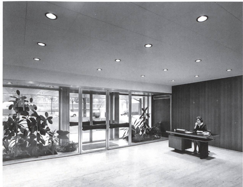
Eingangsbereich des ehemaligen Wiener Firmensitzes von Hoffmann-La Roche . Nach seiner Neugestaltung wird das Gebäude als Hotel genutzt.