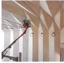
Im Innenraum des Théâtre de Vidy bei Lausanne werden die letzten Arbeiten ausgeführt.