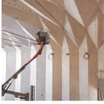
Im Innenraum des Théâtre de Vidy bei Lausanne werden die letzten Arbeiten ausgeführt.