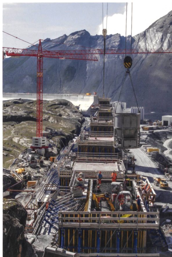
Die Sicht wird weiter, der Platz enger: Beengte Platzverhältnisse herrschten besonders im Bereich der schmalen Mauerkrone beim Betonieren der Stauwand.

Das Betonieren der einzelnen Blöcke erfolgte in Etappen von je 3 m Höhe. Die sechs jeweils einen halben Meter