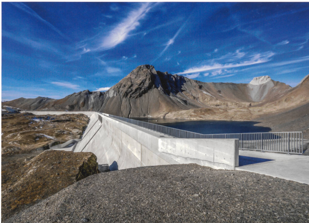
Staumauer Muttsee mit Hochwasserentlastungsanlage (Bildmitte) und dem Muttsee vor seinem Aufstau. Blick nach Westen.

Höhenlage und nutzbares Wasservolumen sind die Zauberwörter, die bei der Wasserwirtschaft die Augen feucht werden lassen. Zusammen ergeben diese beiden Faktoren potenzielle Energie, die über Turbinen und Generatoren in