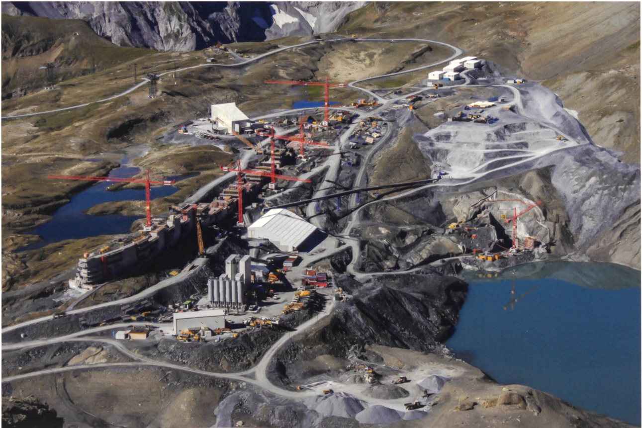
Logistik beim Staumauerbau: Die weissen Container rechts oben im Bild sind die Unterkünfte der Arbeiter. Darunter liegen die Deponieflächen der Gesteine aus dem Stollen- und Kavernenbau. Förderbänder transportieren das Gestein zur Aufbereitungsanlage (weisse Halle in der Bildmitte). Davor steht das Betonierwerk. Sämtliche Materialien werden mit der Bauseilbahn 2 (Masten und weisses Gebäude auf der Luftseite der Mauer) herauftransportiert. Oberhalb steht die Muttseehütte des SAC. Am abgesenkten See, unterhalb der Deponie, liegt die Baustelle der Ein- und Auslaufbauwerke, durch die das Wasser zum Kavernenkraftwerk geleitet wird.