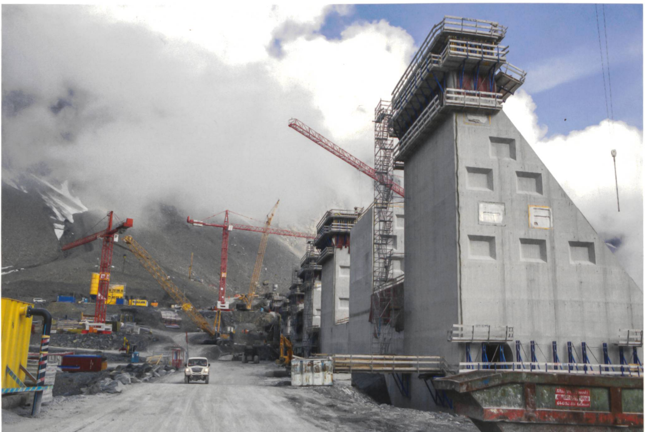
Bau der Mauer mit Kletterschalungen im Pilgerschrittverfahren. Die Aussparungen zur Verzahnung der einzelnen Blöcke und der Kontrollgang unten links sind gut erkennbar. Der Block ohne Kletterschalung musste aufgrund ungenügender Betonqualität teilweise rückgebaut und neu erstellt werden.

Die bestehende Sohle des Muttsees weist eine praktisch wasserundurchlässige Gesteinsschicht auf. Aufwendige, grossflächige Dichtungsmassnahmen konnte man sich somit ersparen. Die Planungen einer oberflächlichen Abdichtung mit Spritzbeton im neuen, vergrösserten Aufstaubereich am wasserseitigen Fuss der Staumauer konnten im Zuge der Bauarbeiten eingestellt werden. Eine detaillierte geologische Abklärung bestätigte nach Freilegung dieses Felsbereichs eine genügende Dichtigkeit des Areals.