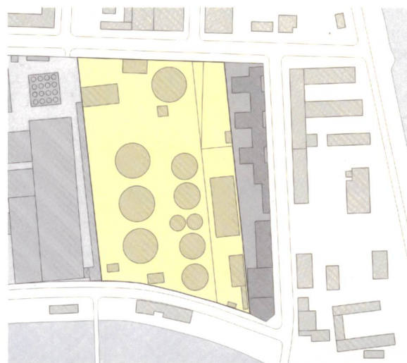
Auf dem ca. 29000 m 2 grossen Grundstück, umgeben von Gewerbe- und Wohnbauten, befindet sich momentan ein Tanklager mit rund einem Dutzend Öltanks, Mst. 1:5000.

Auf Grundlage des gemeinsam verabschiedeten Masterplans fertigten die Verantwortlichen einen Parzellierungsplan, in dem sie insgesamt 39 Parzellen auswiesen. Jedes beteiligte Architekturbüro soll mit einem Gebäudeentwurf beauftragt werden. Die einzelnen Parzellen wurden schliesslich auf der sechsten Klausurtagung ausgelost: Jedes Büro bearbeitete zunächst drei Entwürfe für drei unterschiedliche Parzellen, um aus diesem Fundus die stimmigste Lösung für das grosse Ganze – die WerkBundStadt – zu finden. Ausserdem diskutierten die Beteiligten auf dieser Klausur die architektonischen Regularien für die Entwürfe der Häuser und legten hierzu ein Regelwerk fest (Link oben rechts). Mit diesen Grundlagen entwickelten die Architekten ab März 2016 ihre Häuser für das Quartier, die