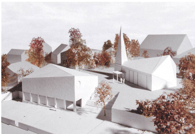
Der Siegerentwurf «Thales» stellt der Kirche mit ihrem expressiven Trapezgrundriss ein präzise gesetztes Volumen gegenüber, das zwischen Fauggersweg und Kirchplatz vermittelt und das zurückgesetzte Grundstück gleichzeitig zum Strassenraum hin öffnet.

Nicht nur das Interesse, auch die Herausforderungen bei diesem offenen Wettbewerb waren gross. Es galt, einen Ersatzbau schlicht und stimmungsvoll in die bestehende Anlage einzupassen und gleichzeitig einen starken räumlichen Bezug zwischen Kirche, Pfarreigebäude und Aussenraum zu schaffen. Die