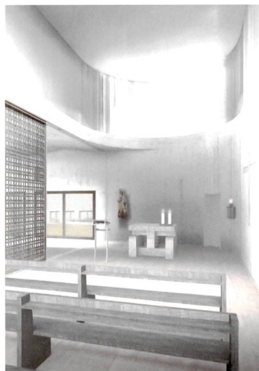
Der Blockrand wird geschlossen, die Kapelle erscheint auf der Visualisierung bescheiden und angemessen. Situation im Mst. 1:3000.

Trotzdem findet das neue Kirchenzentrum zu einem eigenständigen und markanten Ausdruck, der weit über die eigentliche Wohnnutzung hinausweist.