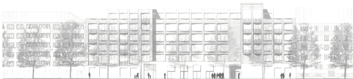
Das Siegerprojekt «Camminato» fügt sich nahtlos in die Umgebung ein, Ansicht Ostfassade Mst. 1:600.