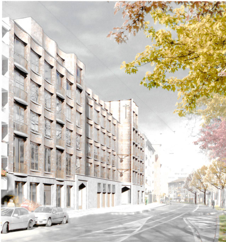
Die horizontale und vertikale Gliederung der Fassade im Siegerprojekt vermittelt geschickt zwischen öffentlichem Ausdruck und einer Einordnung in den Kontext.

D as Pfarrzentrum St. Christophorus liegt unmittelbar an der viel befahrenen Strasse für Pendler und Einkaufstouristen, die den nördlichsten Teil von Kleinhüningen mit Weil am Rhein verbindet. Es besteht aus einer kleinen Kirche, einem Pfarrhaus, einem Sigristenhaus und einem Pfarreiheim mit Saal und Vereinsräumen. Die römisch-katholische Kirche des Kantons Basel-Stadt scheut die anstehende Sanierung angesichts kaum vertretbarer Kosten.