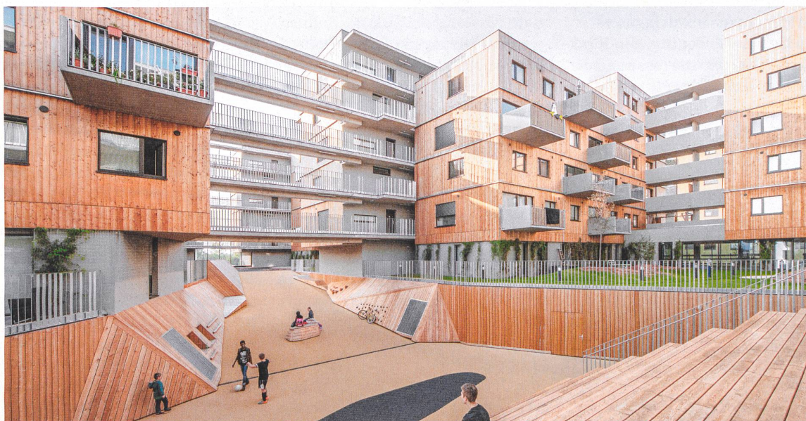
Der «Canyon» in der Wiener Wohnanlage Seestadt Aspern nach Plänen von Berger + Parkkinen und Querkraft Architekten.