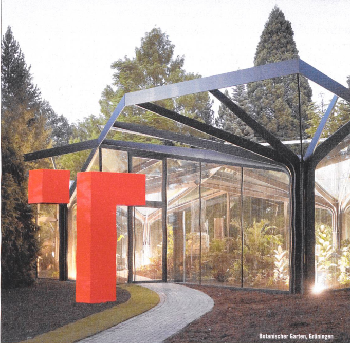
Botanischer Garten, Grünigen