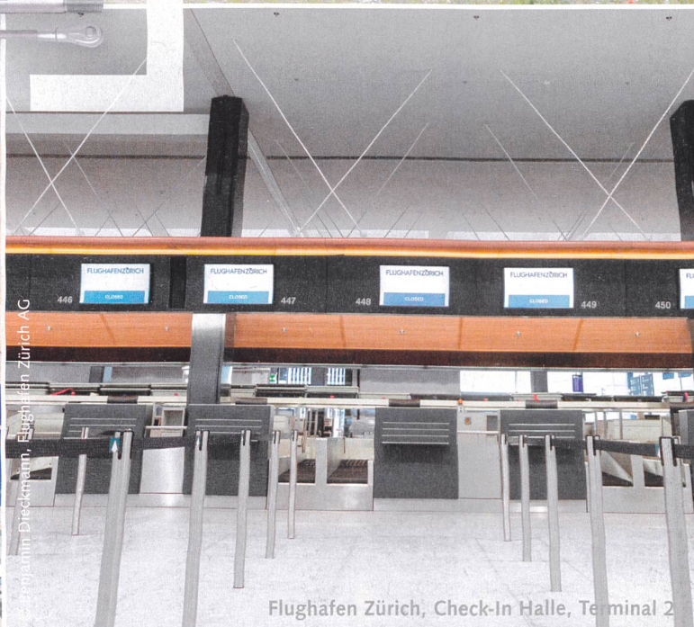
Flughafen Zürich, Check-In Halle, Terminal 2

DETAN Stabsysteme. Die Geschichte der Ästhetik. Die moderne Architektur sucht gleichzeitig zweckmässige und funktionelle, gestalterisch aussergewöhnliche Umsetzungen. Mit dem DETAN Stabsystem bietet HALFEN eine wegweisende und innovative, technisch ausgereifte Produktlösung mit hohem Einbaukomfort. Das DETAN Stabsystem