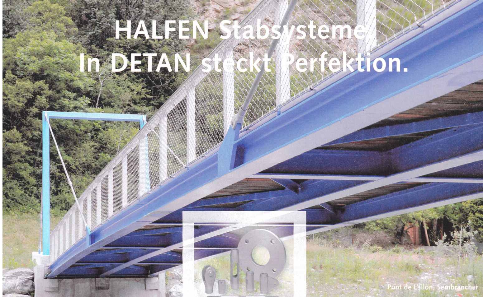
Pont de L'illon, Sembracher