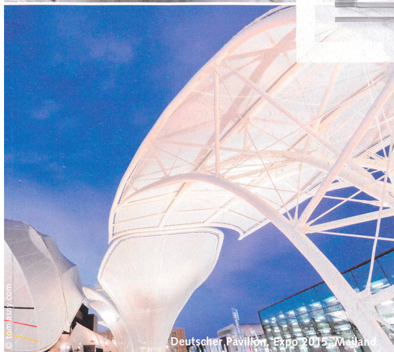
Deutscher Pavillon, Expo 2015, Mailand