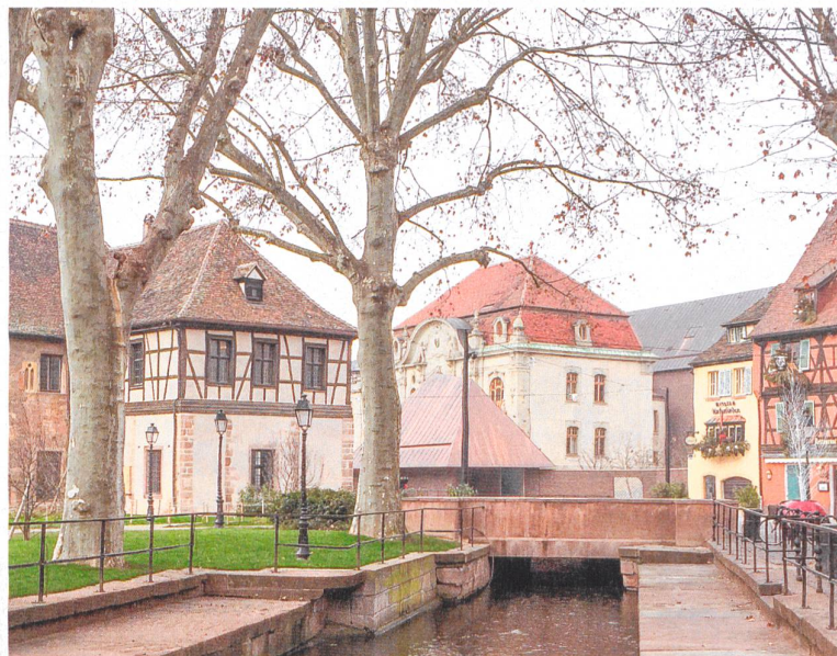
Museum Unterlinden in Colmar, von der Altstadt her gesehen: links das mittelalterliche Kloster, in der Mitte die ehemaligen kommunalen Bäder, davor das neue «Haus» und dahinter der neue Ausstellungstrakt «Ackerhof».