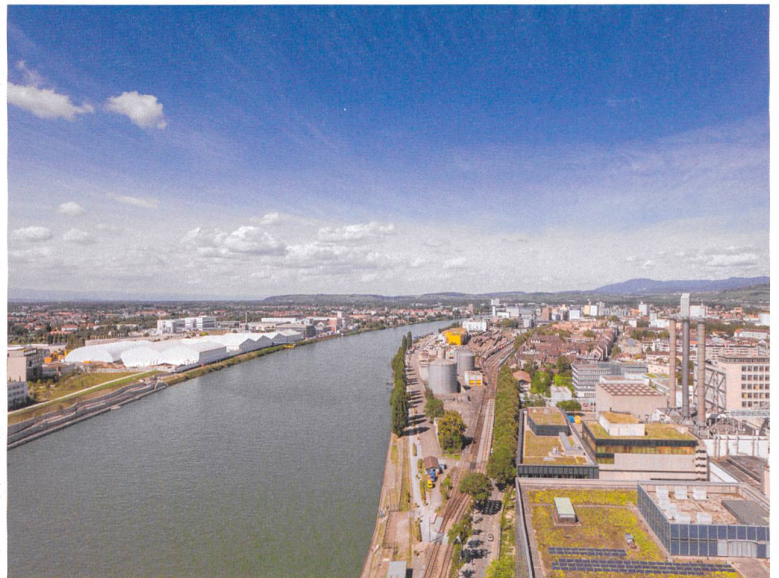
Blick auf das Entwicklungsgebiet 3Land.