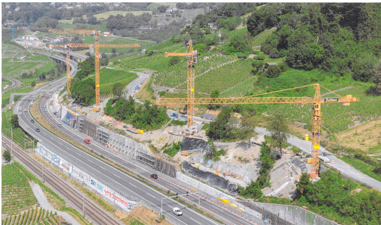
Das Pilotprojekt für die Verstärkung der Stützmauer an der A5 und A9 umfasste 38 Stützbauwerke und kostete 150 Millionen Franken.