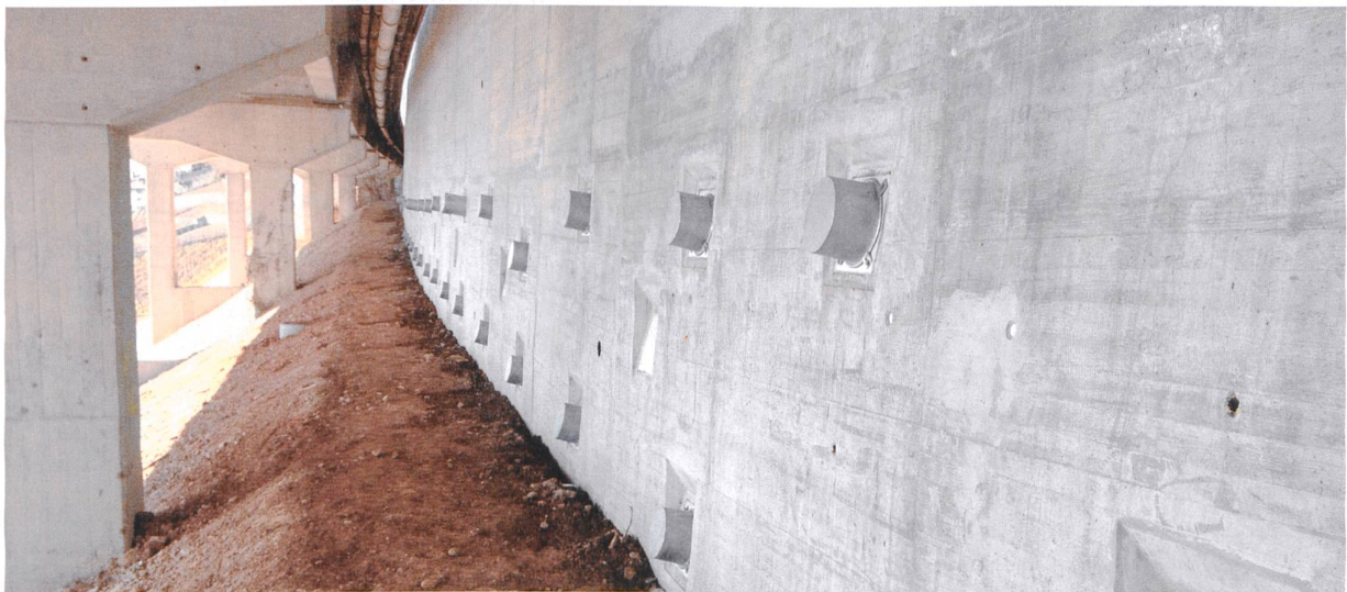
Oben: A9 bei Le Lanciau VD: Verstärkung einer bergseitigen Nagelwand mittels vorgespannter Ankerwände.