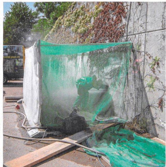
Beispiel einer Untersuchung an bestehenden Winkelstützmauern: talseitiger Höchstdruckwasserabtrag mit vorgängigem Aushub.

Im Allgemeinen ist die Karbonatisierungstiefe in diesem kritischen Bereich gering, und es wurden weder im Beton noch im Boden korrosionsfördernde Substanzen gefunden. Die Korrosion ist also ausschliesslich auf den porösen Beton und allenfalls auf eine zu geringe Bewehrungsüberdeckung zurückzuführen, wodurch der Alkalischutz für die Bewehrung nicht