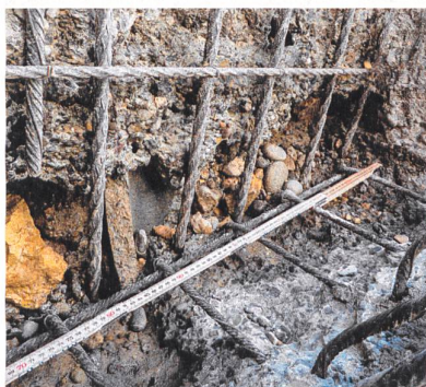
Hauptbewehrung eines Stützbauwerks mit niedrigem Korrosionsgrad und Querschnittsverlust.