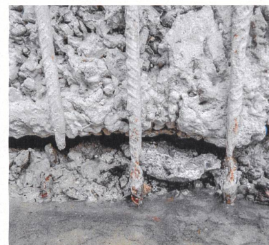
Hauptbewehrung eines Stützbauwerks mit erheblichem Korrosionsgrad und Querschnittsverlust.

gewährleistet wird und es zu einer elektrochemischen Korrosion durch Makroelementbildung kommt. Auch am Fundament wurden bei einigen Werken Schäden als Folge unzureichender Überdeckung festgestellt.