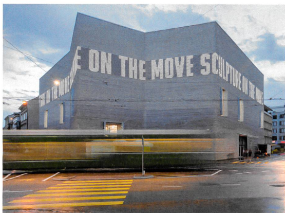
Eingelegte LED-Streifen in den Rillen der Friessteine beleuchten die Hohlkehlen der Backsteine.