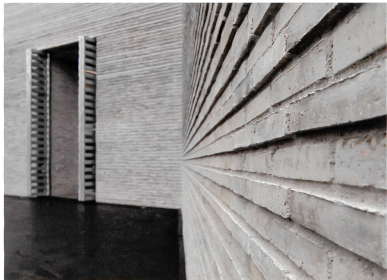
Erweiterungsbau Kunstmuseum Basel: Fassade und Eingang.