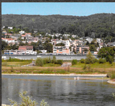
VELOTOUR 13. AUGUST 2016