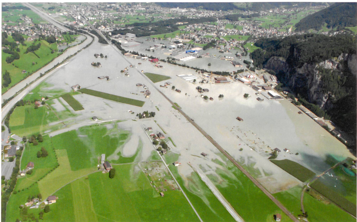
Der unerwartet und unkontrolliert gestaute «Schattdorfer See» (August 2005).