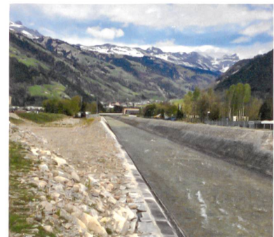
Der seitliche Geschiebesammler am Schächen mit einem Volumen von 100 000 m 3 .

Das Wasserbaugesetz verpflichtet «besonders bevorteilte Dritte» (bbD) zur Kostenbeteiligung. Beim Projekt «Hochwasserschutz Urner Talboden» trifft es mehrere Bundesbetriebe. Die Druckbrücke, über die der Bahnverkehr rollt, wurde mit Mitteln von AlpTransit finanziert. Das Bundesamt für Strasse (Astra) beteiligte sich ebenfalls an den Investitionen und dem Unterhalt der Schutzbauten, da die Reussautobahn betroffen ist. Und ebenso ist die Ruag, der staatliche Rüstungskonzern, involviert, weil das Firmengelände vor elf Jahren komplett überschwemmt wurde. Fast der gesamte Teil des Landbedarfs für den neuen Geschiebesammler und die Profilausweitung des Schächen konnten zudem auf Reserveflächen der Ruag realisiert werden. Weitere Betriebe in der Gewerbezone von Schattdorf bleiben von der Kostenpflicht allerdings verschont. Grundsätzlich hätten sogar 120 Betriebe beteiligt werden können; die Kantonsregierung hat aber darauf verzichtet, weil sonst der Verhandlungs- und Berechnungsaufwand zu gross geworden wäre, so die Begründung im Kantonsparlament. (pk)