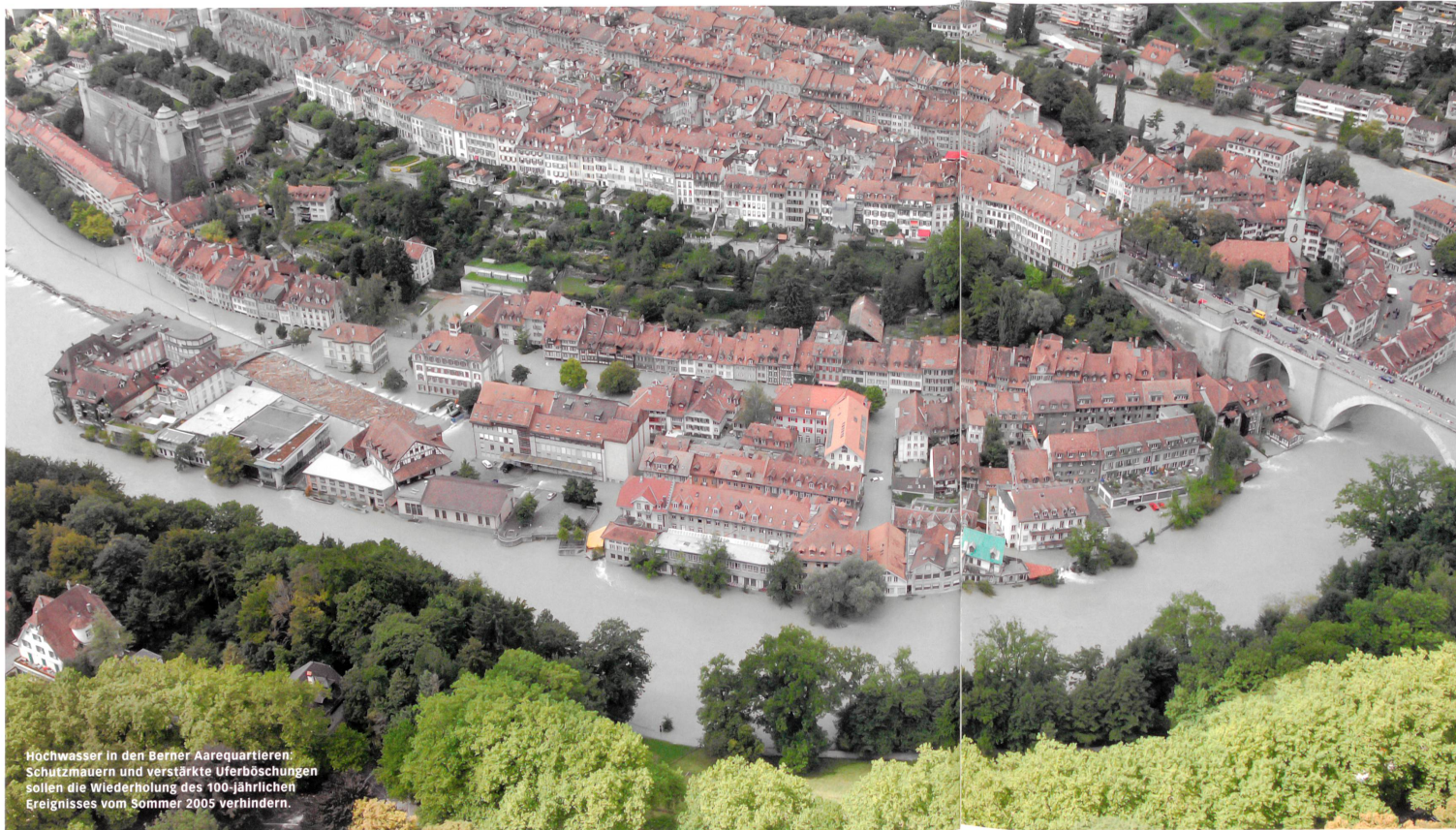
Hochwasser in den Berner Aarequartieren. Schutzmauern und verstärkte Uferböschungen sollen die Wiederholung des 100-jährlichen Ereignisses vom Sommer 2005 verhindern.