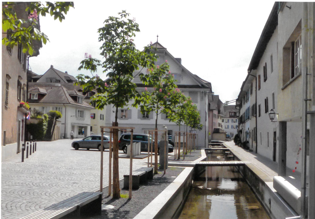
Sursee mit sanierter Altstadt und optimiertem Kanal: ein Masterplan zur Verbesserung des Hochwasserschutzes an der Sure.

3 «Gewässerraum im Siedlungsgebiet eröffnet neue Chancen», in ZUP Wasser, Kanton Zürich 2014.