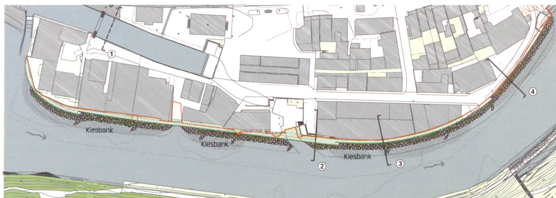
Hochwasserschutzmassnahmen an der Aare, Abschnitt Mattequartier: ① beidseitige Schutzmauern bis Schutzkote, ② linksufrige Schutzmauer (vgl. Plan unten), ③ Schutzmauer auf Höhe HQ100, ④ Schutzmauer bis Schutzkote, — bisherige Uferlinie. Mst. 1:2500.

(HQ100) mit 600 \text{ m}^3/\text{s} Abfluss schadlos übersteht. Die Umsetzung in der Berner Matte weicht leicht davon ab: Die Krone der Ufermauer wird auf den HQ100-Pegel ausgelegt. Das sonst übliche Freibord, das bis zum HQ300-Ereignis (mit Abfluss 660 \text{ m}^3/\text{s} ) schützt, muss jedoch mit mobilen Schutzelementen abgeriegelt werden. Daher muss die Berufsfeuerwehr bei jedem Einsatz prüfen, ob die Schutzmauern mit Dammbalken zu erhöhen sind. Die angemessene Mauerhöhe wurde in einer städtebaulichen und ästhetischen Abwägung bestimmt. «Die Quartiere dürfen auf keinen Fall eingemauert werden», erklärt Toni Weber, w+s Landschaftsarchitekten, die gestalterische Leitidee im Hochwasserschutzprojekt. Die Bearbeitung ist dabei an ein interdisziplinäres Team aus Wasserbauspezialisten, Landschaftsarchitekten und Städtebauern übertragen worden. Und im Vorfeld haben behördeninterne Aussprachen mit der Eidgenössischen Natur- und Heimatschutzkommission und der Eidgenössischen Kommission für Denkmalpflege stattgefunden, damit die bauliche Hochwasservorsorge in nächster Nähe zum Weltkulturerbe, der Berner Altstadt, visuell möglichst schadlos umgesetzt wird.