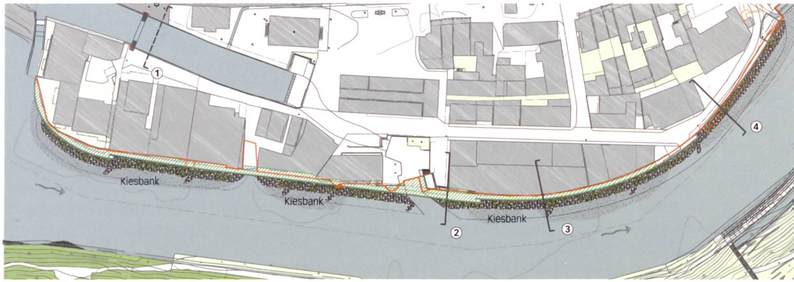
Hochwasserschutzmassnahmen an der Aare, Abschnitt Mattequartier: ① beidseitige Schutzmauern bis Schutzkote, ② linksufrige Schutzmauer (vgl. Plan unten), ③ Schutzmauer auf Höhe HQ100, ④ Schutzmauer bis Schutzkote, — bisherige Uferlinie. Mst. 1:2500.

(HQ100) mit 600 \text{ m}^3/\text{s} Abfluss schadlos übersteht. Die Umsetzung in der Berner Matte weicht leicht davon ab: Die Krone der Ufermauer wird auf den HQ100-Pegel ausgelegt. Das sonst übliche Freibord, das bis zum HQ300-Ereignis (mit Abfluss 660 \text{ m}^3/\text{s} ) schützt, muss jedoch mit mobilen Schutzelementen abgeriegelt werden. Daher muss die Berufsfeuerwehr bei jedem Einsatz prüfen, ob die Schutzmauern mit Dammbalken zu erhöhen sind. Die angemessene Mauerhöhe wurde in einer städtebaulichen und ästhetischen Abwägung bestimmt. «Die Quartiere dürfen auf keinen Fall eingemauert werden», erklärt Toni Weber, w+s Landschaftsarchitekten, die gestalterische Leitidee im Hochwasserschutzprojekt. Die Bearbeitung ist dabei an ein interdisziplinäres Team aus Wasserbauspezialisten, Landschaftsarchitekten und Städtebauern übertragen worden. Und im Vorfeld haben behördeninterne Aussprachen mit der Eidgenössischen Natur- und Heimatschutzkommission und der Eidgenössischen Kommission für Denkmalpflege stattgefunden, damit die bauliche Hochwasservorsorge in nächster Nähe zum Weltkulturerbe, der Berner Altstadt, visuell möglichst schadlos umgesetzt wird.