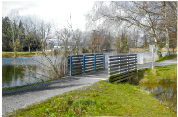
Am Anfang stand der Naturschutz, die Erholung kam später dazu.

spielsweise auf das Zürichseeufer, den Uetliberg oder die landschaftlich ansprechende Tösslegg. Die Räume dazwischen bleiben hingegen mehrheitlich unbeachtet. Zudem birgt deren Lage in Landwirtschaftszonen oder in Naturschutzgebieten oft Potenzial für Nutzungskonflikte: Hier gilt Erholung eher als störend denn als bereichernd.