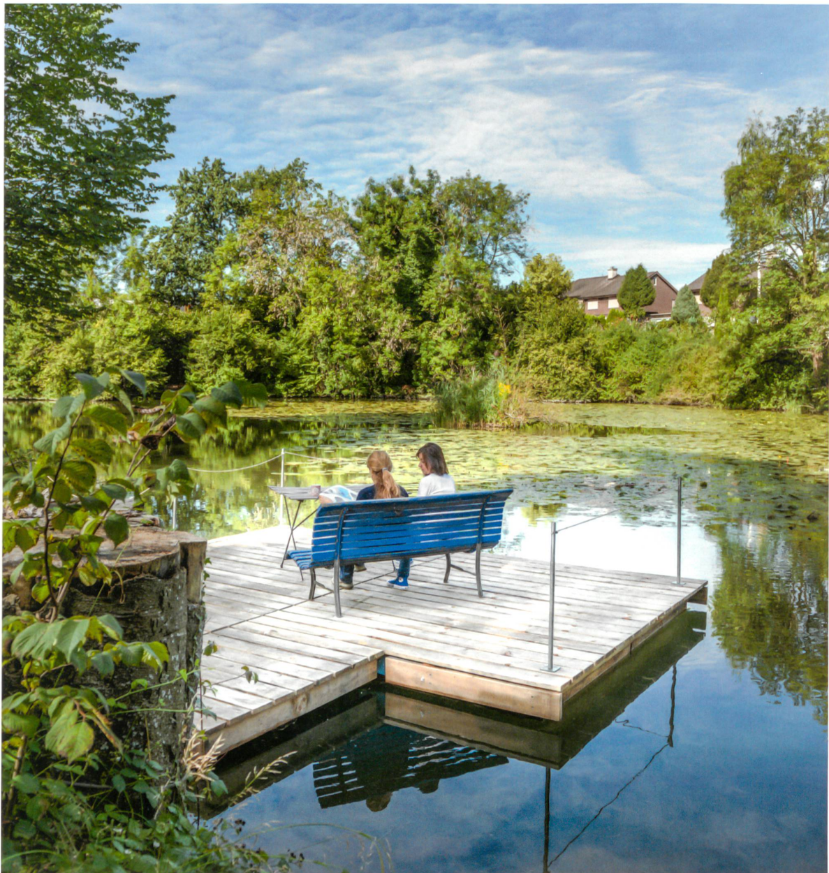
Kleiner Eingriff mit grosser Wirkung: Der neue Steg in Wetzikon eröffnet eine veränderte Perspektive auf die Landschaft.