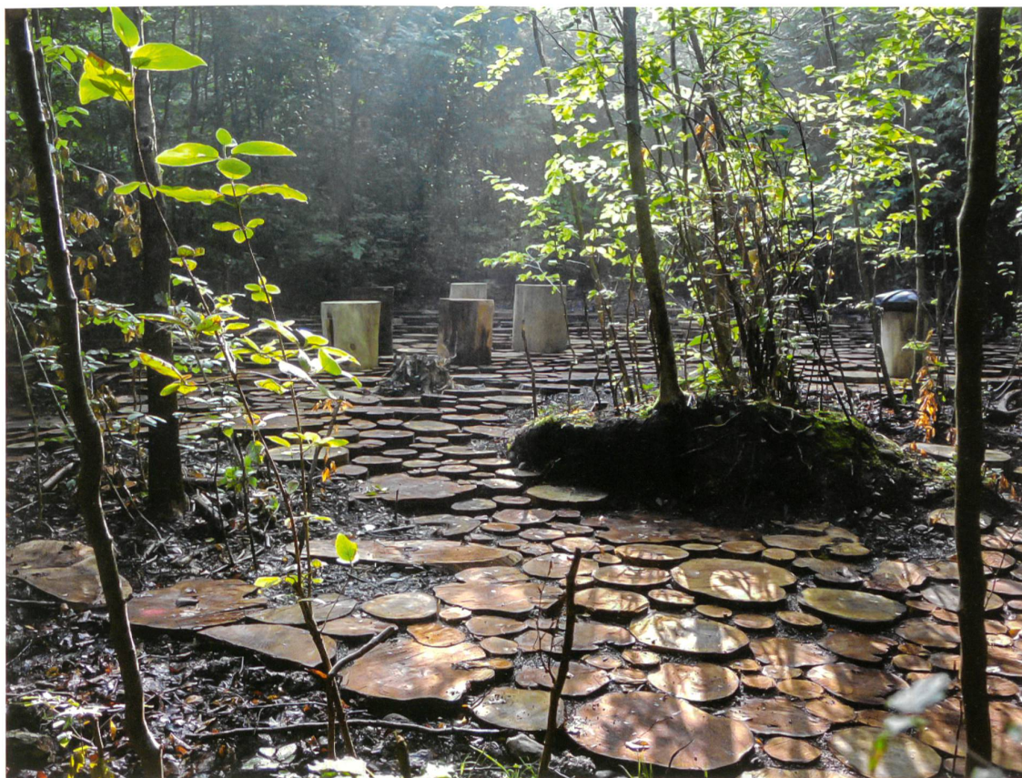
Die Gestaltung des Bodens macht aus der Lichtung einen Platz.

WILDWOOD PLAZA, HEGETSBERGSTRASSE, FORHÖLZLIWALD, USTER Planungsbüro: Robin Winogrand Landschaftsarchitekten, Zürich (heute: Studio Vulkan Landschaftsarchitektur, Zürich) Auftraggeber: Stadt Uster, Bauamt Planung: 2012 Realisierung: 2014