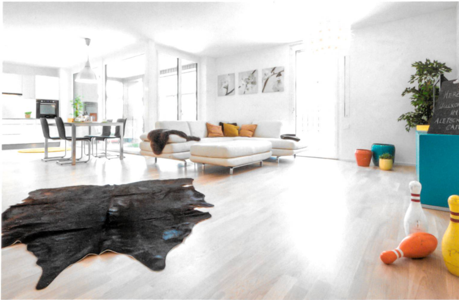
199 Ego®Fresh Mehrraum-Lüftungssysteme im MINERGIE® Referenzobjekt Aletsch Campus, Naters.

Intelligente Lüftungssysteme liegen im Trend; dabei werden dezentrale Einzelraumlüftungsgeräte aus mehreren Gründen immer interessanter. Eine dezentrale Lüftung wie Ego®Fresh ist einerseits aufgrund der einfacheren Planung und den geringeren Baukosten kostengünstiger als ein zentrales System. Andererseits eignet sich Ego®Fresh auch hervorragend bei Sanierungen.