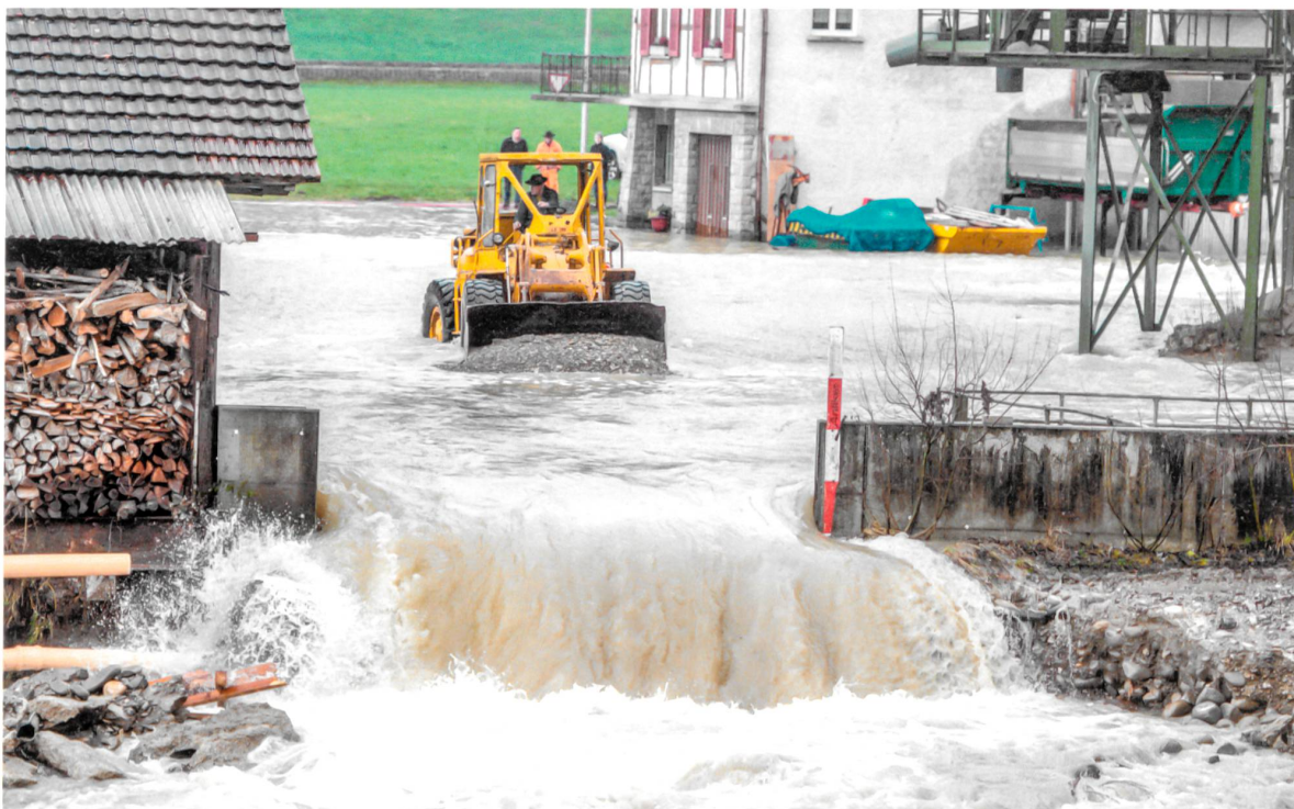
Am 11. Januar 2016 in Wolhusen LU : Nach einem Felssturz in die Kleine Emme folgten Überflutungen und Stromausfälle .

der TGV-Verbindung waren plötzlich viel mehr Passagiere diesem Risiko ausgesetzt. Um dieses wieder auf ein vertretbares Ausmass zu reduzieren, errichtete man für zwei Millionen Franken Steinschlagnetze. Dumm nur, dass der TGV heute nicht mehr durchs Val de Travers fährt. Ein anderes Beispiel: Die Bahnstrecke Zürich–Bern verläuft kurz nach Olten am Fuss des Born, eines Jura-Ausläufers. Durch die Frequenzsteigerung im Rahmen von Bahn 2000 wurde dieser Abschnitt zu einem Hotspot des SBB-Netzes bezüglich Naturgefahren. Der Zugverkehr war plötzlich so dicht, dass sich umgerechnet ständig 200 Personen im gefährdeten Gebiet aufhielten. Aus diesem Grund bauten die SBB Steinschlagschutzwände. Auf der Gotthard-Bergstrecke hingegen wird nach der Inbetriebnahme des Gotthard-Basistunnels infolge der geringeren Passagierfrequenzen das Risiko abnehmen.