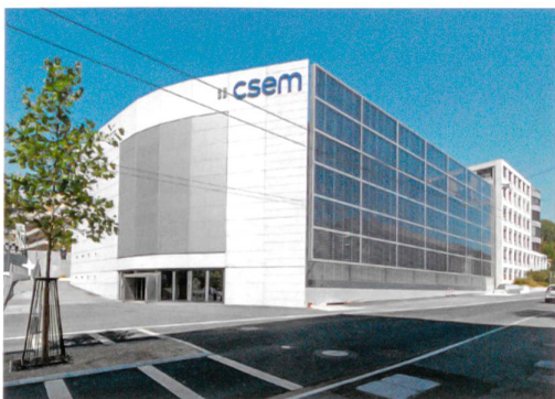
Nach der Instandsetzung: Die postmoderne Hauptfront mit dem Logo auf der Westseite blieb weitgehend unverändert. Neu ist die Fassade mit den PV-Elementen, die vor die bestehende Südwand gestellt wurde. Sie vereinheitlicht die Höhe des Baus und rückt ihn in die Strassenflucht.