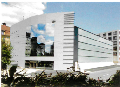
Vor der Instandsetzung: Die Südfassade war gegenüber der Strassenflucht zurückversetzt und niedriger als die Hauptfront auf der Westseite.