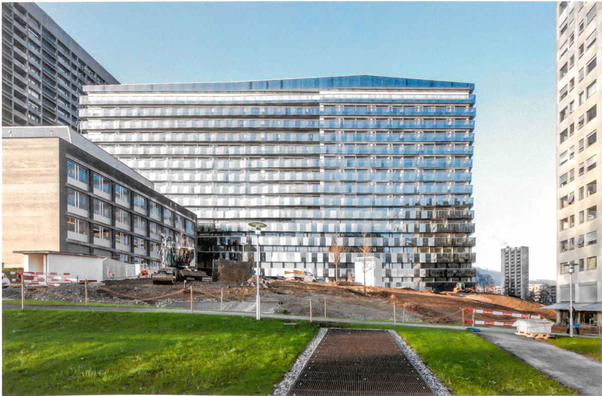
Zwei transparente Glasschichten umhüllen das Bettenhaus.