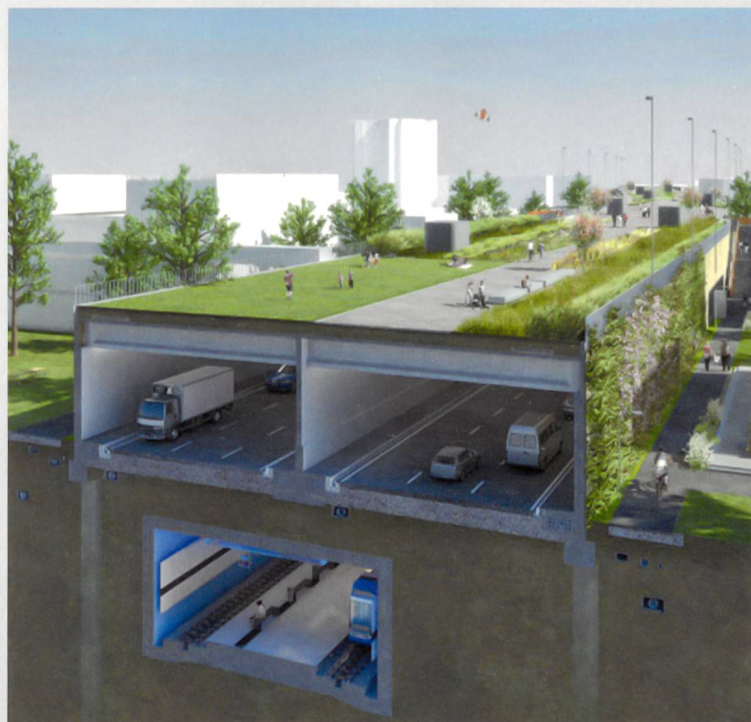
Einhausung Schwamendingen, Zürich (Visualisierung)