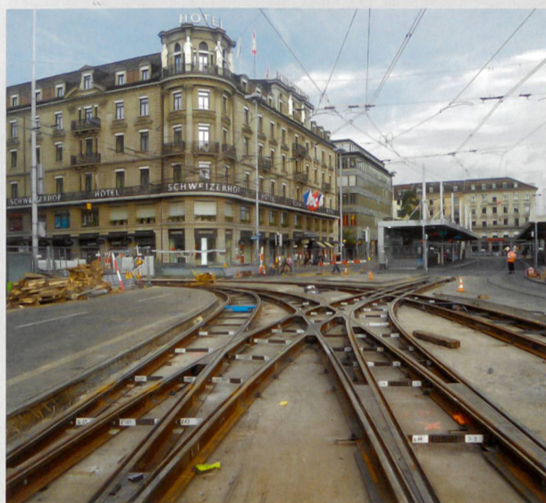
Gleisersatz Bahnhofplatz, Zürich

Weitere Informationen finden Sie unter www.emchberger.ch