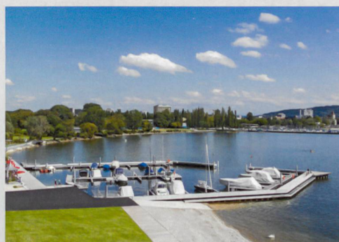
Oben: Um- und Neubau Stadtspital Triemli, Zürich Unten: Beaurivage, Biel

Hochschulen. Zudem investieren wir viel in die Förderung und Weiterentwicklung unserer Mitarbeitenden. Weitere Kernelemente, die uns zu einem attraktiven Arbeitgeber machen, sind unsere interessanten, komplexen und multidisziplinären Projekte sowie unsere Arbeitsbedingungen.