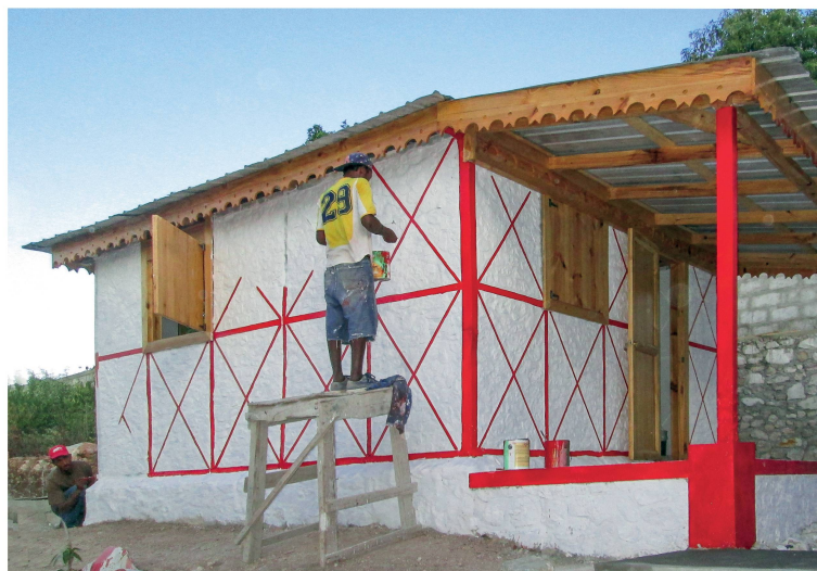
Letzte Pinselstriche an einen wirbelsturmsicheren Wohnhaus in Jérémie.