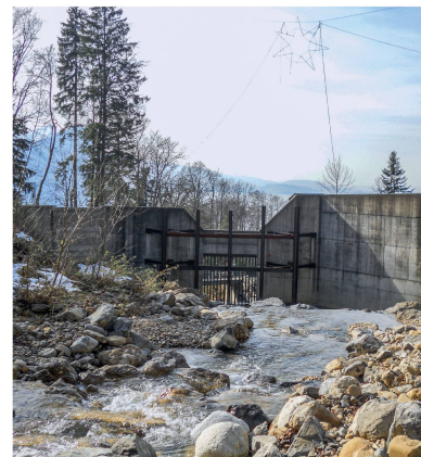
Geschiebesammler im Einzugsgebiet des Altdorfbachs in Vitznau. Seine Kapazität vermag lediglich das Material eines Murgangereignisses mit Wiederkehrdauer von 30 Jahren aufzunehmen.

haben. Unzählige spontane Wasseraustritte führten auch im Wald zu Rutschungen. «Wir schenken den Rutschprozessen heute viel mehr Aufmerksamkeit als früher», sagt Silvio Covi, der als Schutzwaldbeauftragter des Kantons die Luzerner Rigigemeinden seit 28 Jahren betreut. Die Begehungen nach dem Unwetter hätten gezeigt, dass die Bäume im grossflächig wirkamen Schutzwald riesige Mengen an Erdmaterial, Steinblöcken und Holz effizient aufzuhalten vermochten.