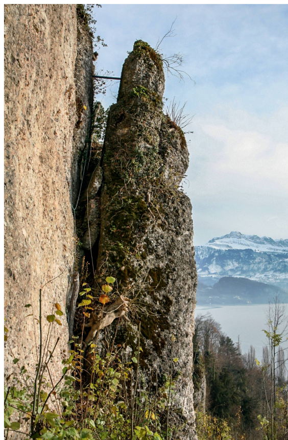
Die Bewegung des Felssturms H16 wurde mittels Telejointmeter im Rohr überwacht. Der Fels ist inzwischen abgetragen worden.