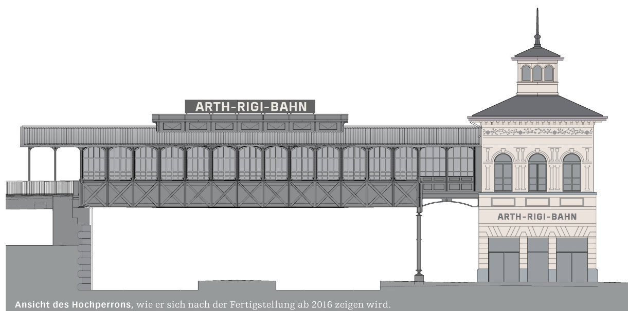
Ansicht des Hochperrons, wie er sich nach der Fertigstellung ab 2016 zeigen wird.

Der Hochperron soll künftig als geschlossener gleisloser Warte- und Schalteraum genutzt werden. Die Stahlkonstruktion wurde deshalb so instandgesetzt, dass sie die neuen Nutzungsanforderungen erfüllt. Die Züge fahren aus bahnbetrieblichen Gründen nicht mehr in den Hochperron ein. Laut Martin Hofmann, Projektleiter von den Ingenieuren Gruner Berchtold Eicher, zeigte ein Vergleich der veränderlichen Lasten, dass die künftigen Nutzlasten um ca. 30% geringer sind als die früher angenommenen. 2 Die nutzungsspezifischen und bauphysikalischen Anpassungen ergaben nahezu einen Lastausgleich. Das Haupttragssystem blieb deshalb unverändert, und seine Tragfähigkeit – auch die von einzelnen Profilen – musste nicht erhöht werden.