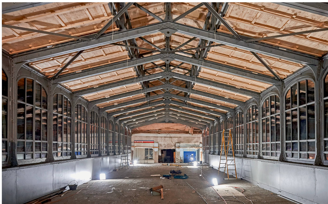
Das Tragwerk des Satteldachs mit dem im First aufgesetzten Oberlicht wurde nachträglich auf den Obergurt der Fachwerkträger gestellt. Es ist eine filigrane Stahlkonstruktion aus Zweigelenkrahmen. Windverbände steifen die Dachebene aus.

den Bahnbauten der Gotthardlinie bilden das Reitergebäude des Hochperrons und das turmartige Stationsgebäude ein Ensemble von besonderem technikk- und kulturgeschichtlichem Wert und von nationaler Bedeutung. Insbesondere das Tragwerk ist ein beeindruckender