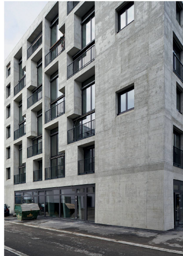
Westfassade des Hauses G (links). Querschnitt durch die Fassade 3. OG (rechts).