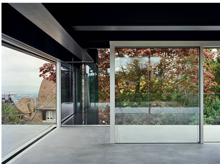
Leichte Räume, schwerer Stahl: das MFH an der Krönleinstrasse in Zürich.