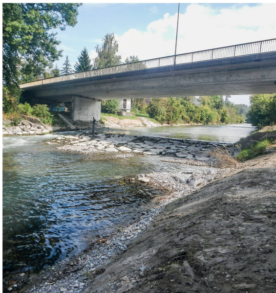
Im Fokus des Umbaus der Messschwelle standen die Erhöhung der Sicherheit und die Fischdurchgängigkeit . Bei entsprechendem Wasserstand profitieren nun aber auch die Kajakfahrer.