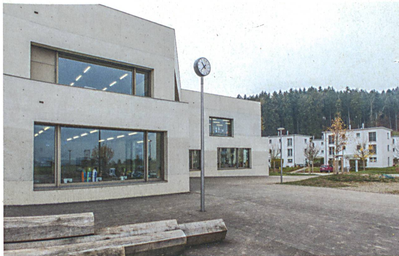
Das Schulhaus in einer Vorortgemeinde von Winterthur erforscht einen neuen Typus: Rund um die Turnhalle sind die Zimmer angeordnet. Für diesen eigenständigen Entwurf gibt es den Hasen in Silber für Adrian Streich Architekten.