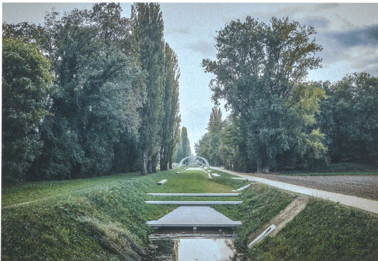
Vor den Toren Genfs wurde die Aire renaturiert: Die kluge Zusammenarbeit von Architektur, Landschaftsgestaltung, Biologie und Ingenieurskunst bringt dem Projekt den goldenen Hasen in der Kategorie Landschaft.

H ochparterre wirft einen Blick zurück auf das vergangene Jahr und zeichnet die besten Projekte aus. Seinem breiten Fokus entsprechend umfassen die Disziplinen neben Architektur auch Landschaft und Design.