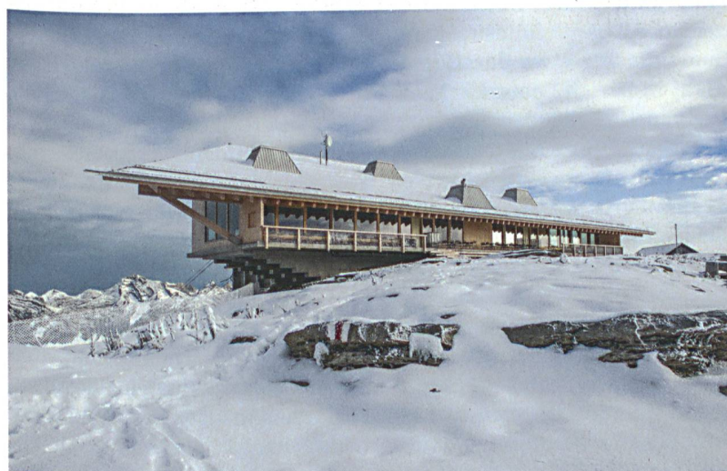
Herzog & de Meuron holen sich den bronzenen Hasen mit ihrem Haus auf dem Chäserrugg. Die Jury würdigt das Spiel mit Bildern und Figuren und eine Bergstation, die zahlreiche Assoziationen weckt.