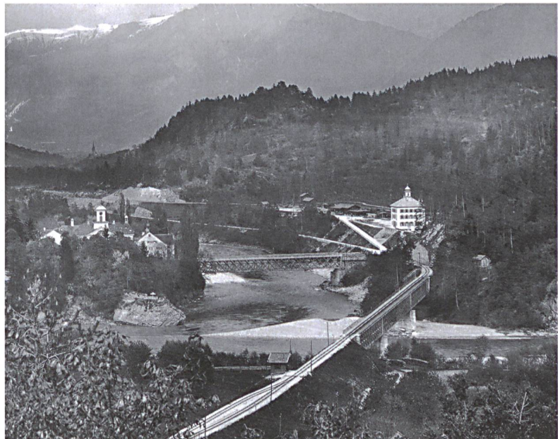
Am Zusammenfluss der beiden Rheine liegt der Weiler Reichenau GR mit seinen bauhistorisch wertvollen Brücken. Blick nach Osten um 1903.