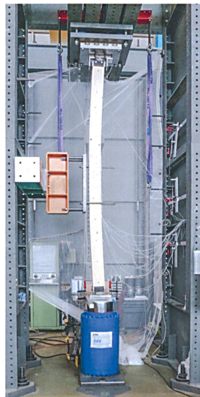
Knickversuche an Brettschichtholz-Stützen an der ETH Zürich

Die Stabilität von Einzelstäben weist man üblicherweise mit dem Ersatzstabverfahren nach. Die entsprechenden Knickkurven und Formeln zur Berechnung der Knickbeiwerte k_C in Funktion der relativen Schlankheit \lambda_{rel} der Stäbe sind in der Norm SIA 265 angegeben. Auch diese Bemessungsansätze wurden aus dem Eurocode 5 in die Schweizer Norm übernommen. Bei der Berechnung der relativen Stabschlankheit, die neben der geometrischen Schlankheit \lambda = l_k/i (Knicklänge l_k , Stabquerschnitt bzw. Trägheitsradius i ) den Einfluss der Materialisierung des Stabes (Elastizitätsmodul) umfasst, geht man wegen der