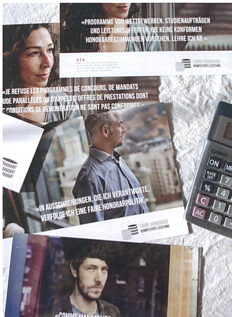
Postkartenmotive zur Charta, die der SIA im Frühjahr an seine Mitglieder versandt hatte.

Aufgeschlüsselt nach den Berufsgruppen, haben 18.5 % der Architekten und Architektinnen, 17 % der Ingenieure und Ingenieurinnen aus dem Bereich Umwelt und jeweils 13 % der Mitglieder der Berufsgruppen Ingenieurbau und Technik die Charta unterzeichnet.