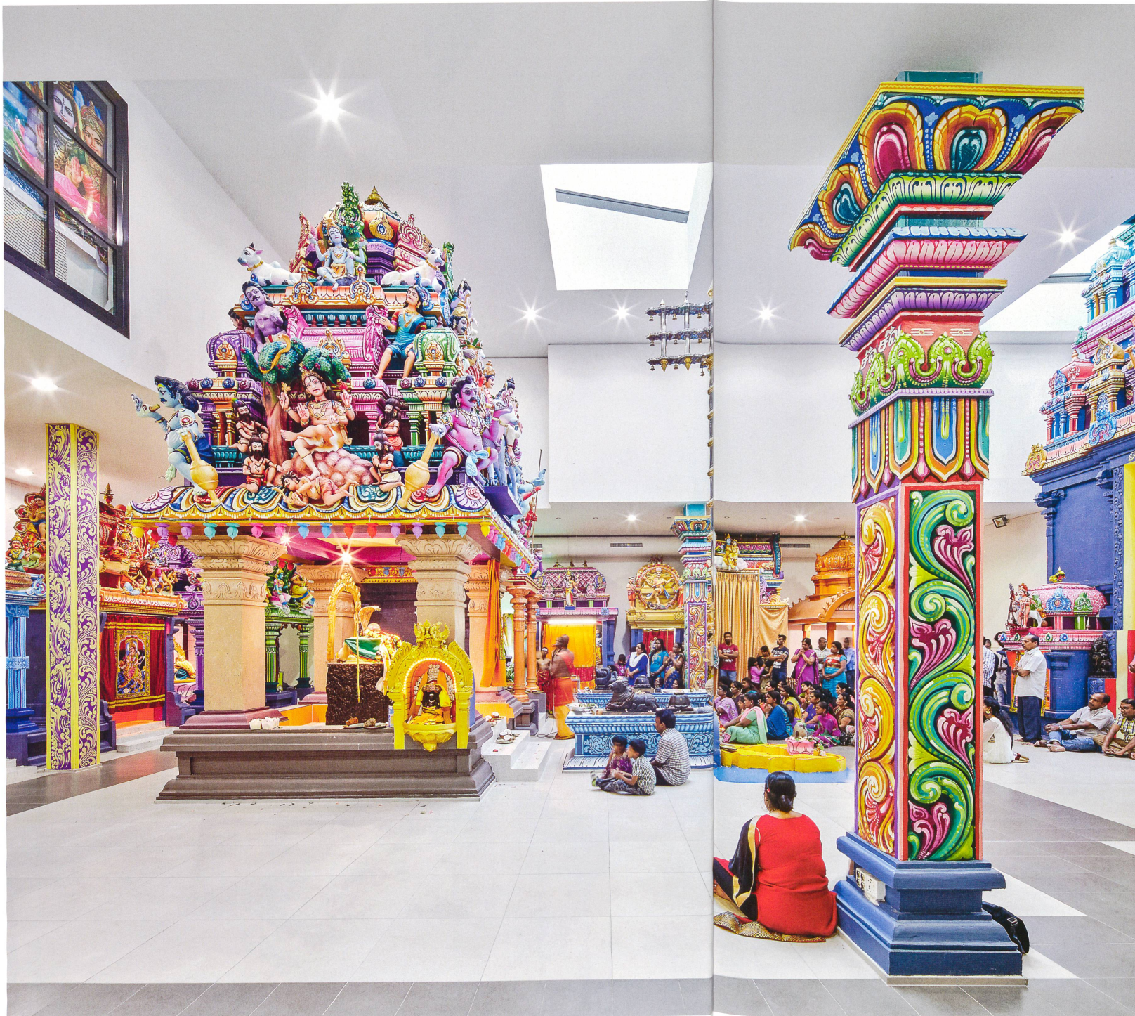
5 Tempel – Hindus