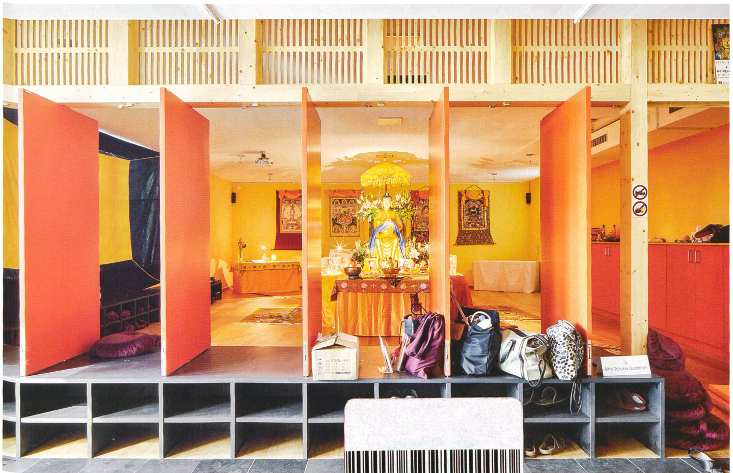
9 Andachtsraum – Buddhisten