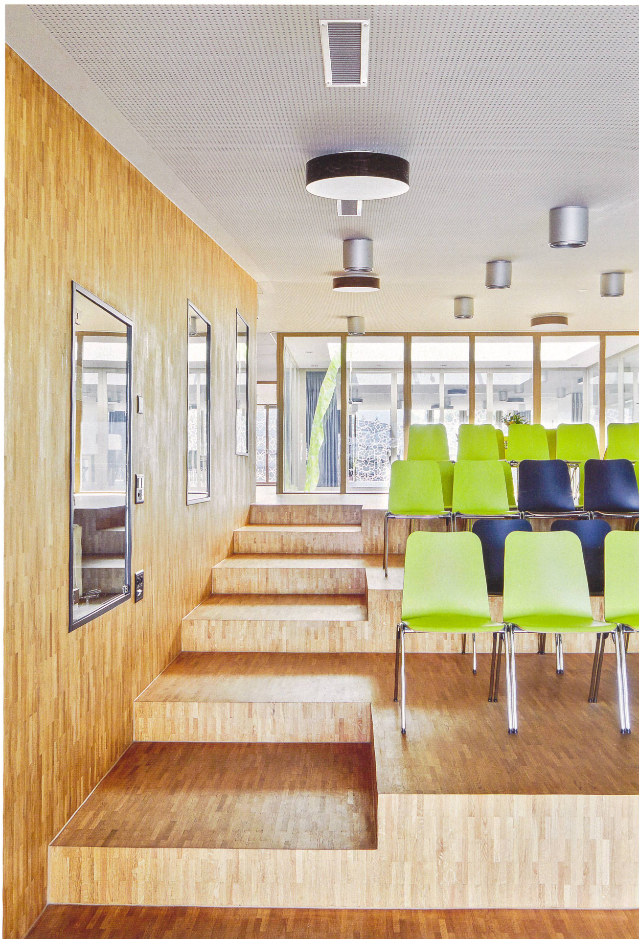
3 Dialogbereich im Obergeschoss