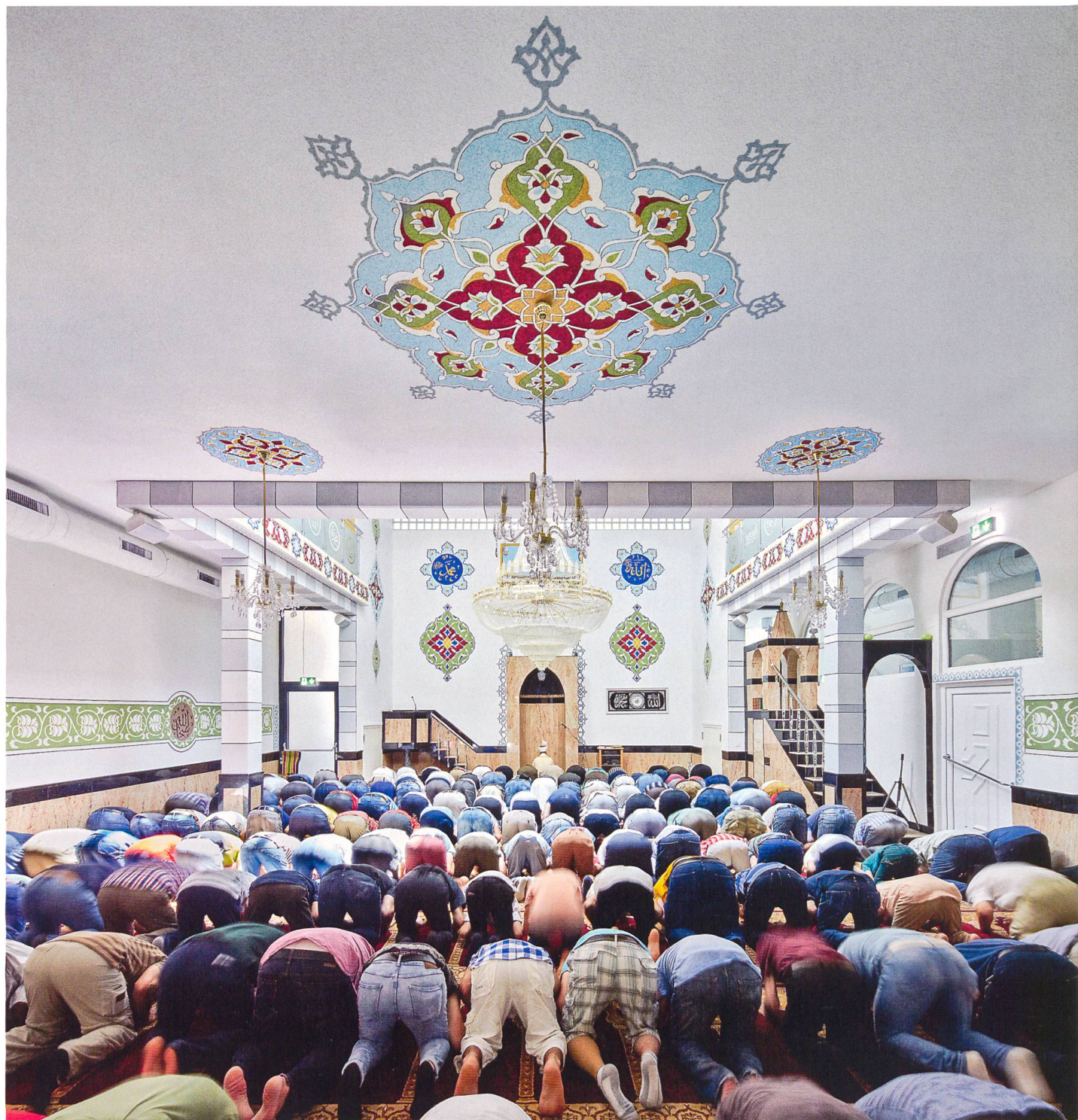
8 Moschee – Muslime