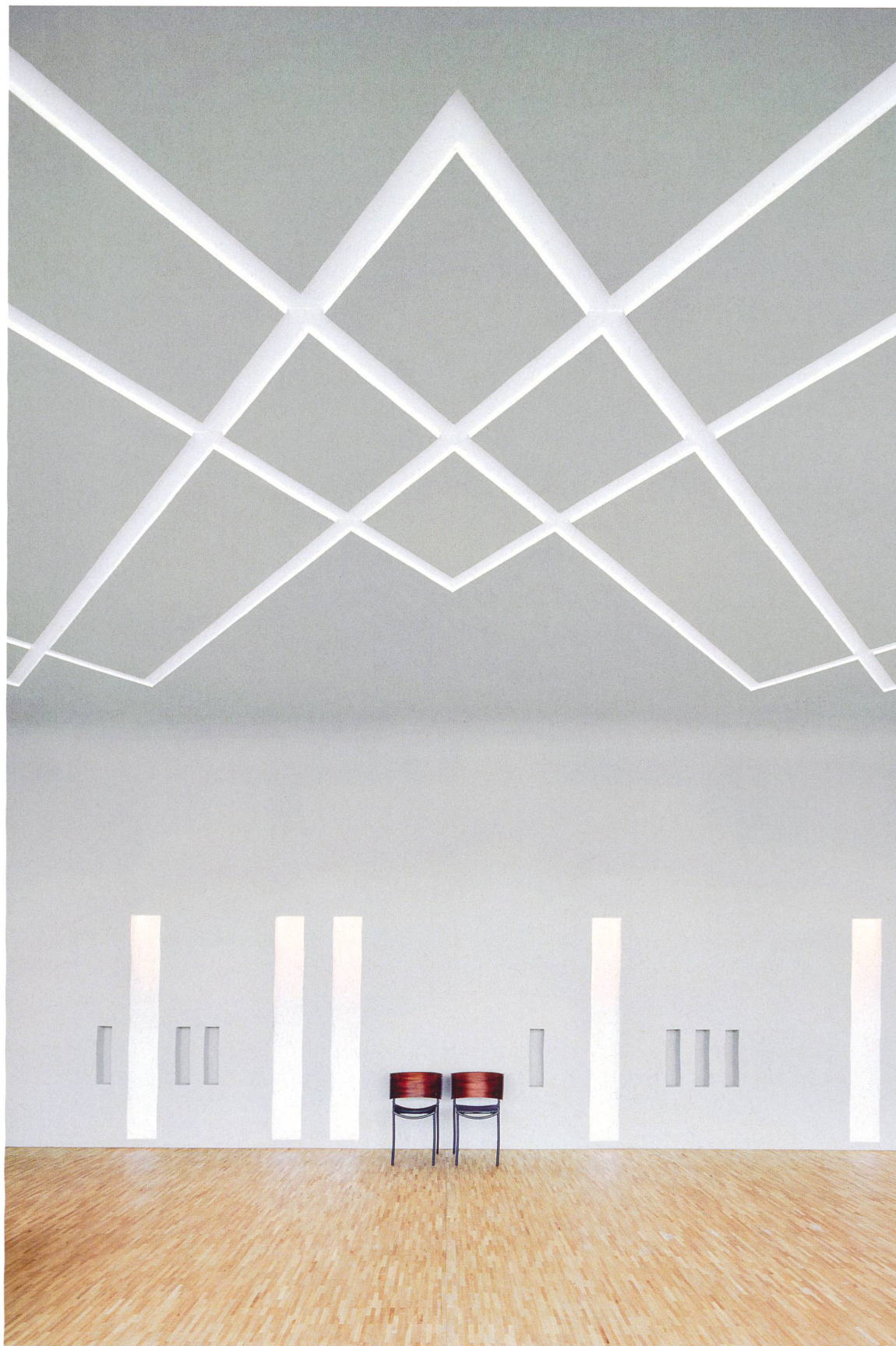
6 Dergâh Aleviten