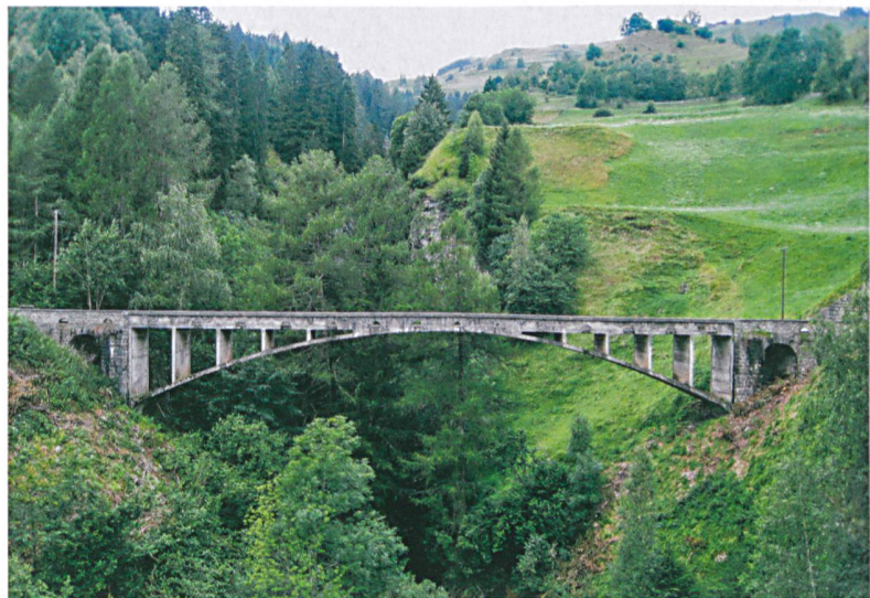
Die Valtschielbrücke bei Donat GR vor der Instandsetzung.