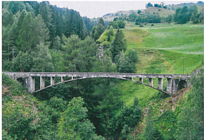
Die Valtschielbrücke bei Donat GR vor der Instandsetzung.