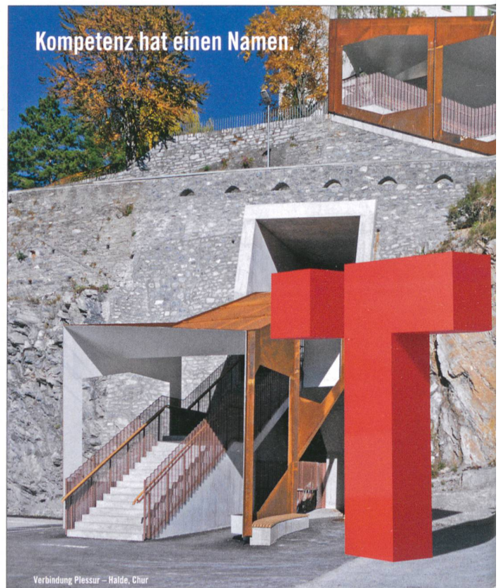
Verbindung Plessur – Halde, Chur