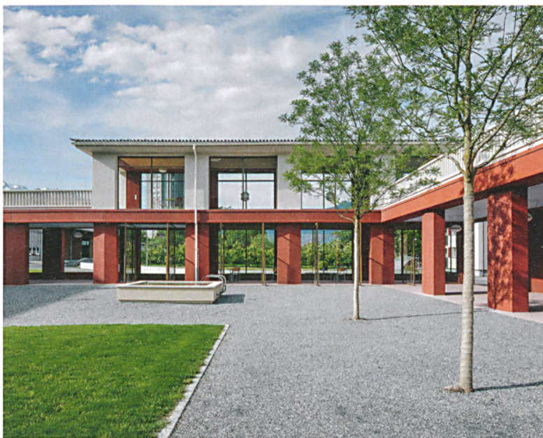
Alters- und Pflegeheim Neugut, Landquart, 2014, Joos & Mathys Architekten, in Zusammenarbeit mit Schmid Schärer Architekten.