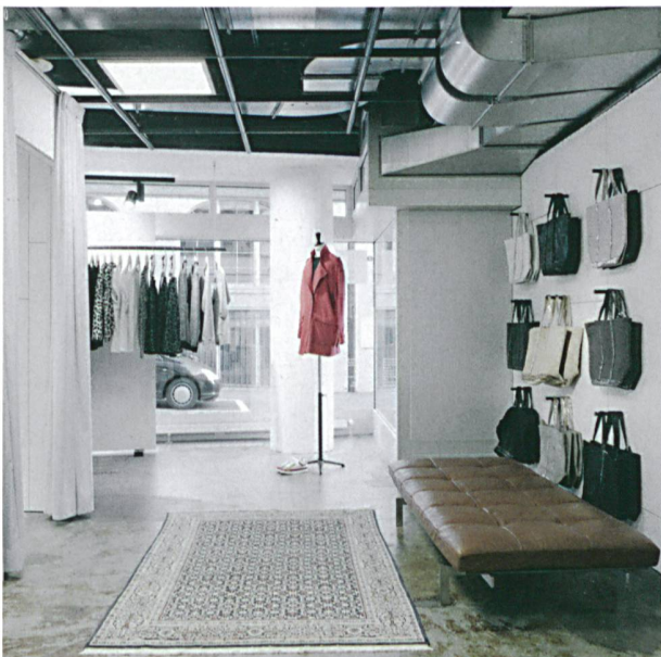
Schlichtes Eldorado für Modebegeisterte: Concept Store «Le Soir Le Jour» in St. Gallen.

Zwischen einem abgeschliffenen, versiegelten Betonboden und einer schwarzen, roh belassenen Technikdecke entstand auf zwei Stockwerken ein knapp 200 m 2 grosses Eldorado für Modebegeisterte. Die schlichte architektonische Sprache lässt die Kleider für sich wirken; für einen Überraschungsmoment sorgen grossformatige Bilder des Schweizer Künstlers Beni Bischof. In seinen Arbeiten reflektiert (und persifliert) er die Hochglanzfotografien der Modezeitschriften. Für ihre aktuelle Winterkollektion liess sich die Designerin Isabel Marant von Tänzern inspirieren. Im Laden wird dies mit der Projektion eines Videos der Tänzerin und Choreografin Pina Bausch untermalt.