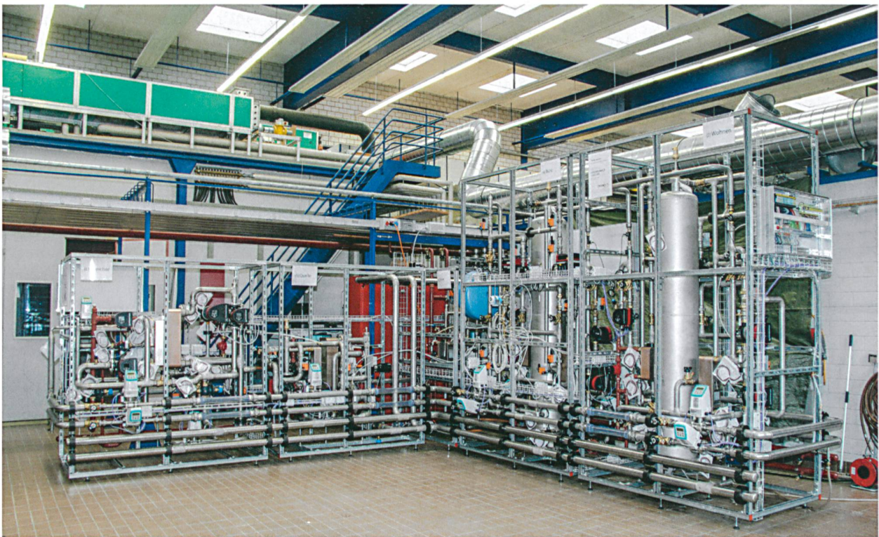
Der Prüfstand des NODES Lab am Zentrum für Integrale Gebäudetechnik an der Hochschule Luzern – Technik & Architektur.