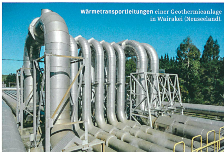
Wärmetransportleitungen einer Geothermianlage in Wairakei (Neuseeland).