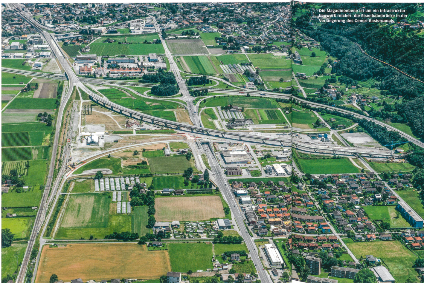
Die Magadinoebene ist um ein Infrastrukturbauprogramm reicher: die Eisenbahnbrücke in der Verlängerung des Ceneri-Basistunnels.