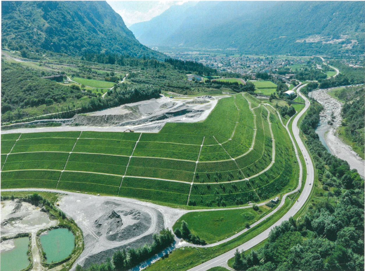
Materialdeponie «Buzza di Biasca»: Das Ausbruchmaterial der Tunnellose Bodio und Faido gelangte über eine Förderbandanlage vom Installationsplatz Bodio ins benachbarte Bleniotal. Dort wurde es in einem ehemaligen Bergsturzgebiet aufgeschichtet.

Sie haben gesagt, bei den Wohnungen und Häusern sei die Nachfrage gestiegen. Ist das eine Chance? Führt das auch zu Problemen?