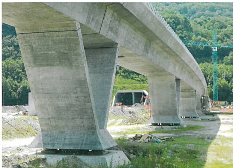
Im Vordergrund die neue Eisenbahnbrücke bei Camorino, im Hintergrund das Portal des Ceneri-Basistunnels.