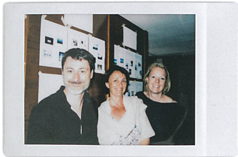
Die TEC21-Redaktion an Bord des Architekturschiffs.