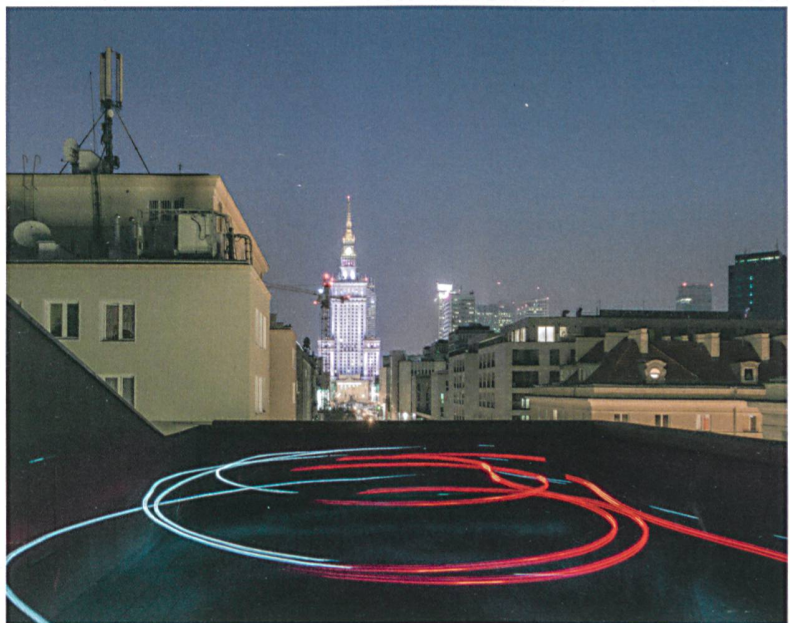
Blick vom Dach der von Diener & Diener umgebauten Foksal Gallery ins nächtliche Warschau: zeitgenössische Kunst vor dem Neotraditionalismus der Nachkriegszeit und heutiger Investorenarchitektur.