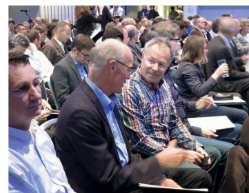
Besucher der Zürcher LHO-Veranstaltung.

der LHO; dass die Ordnung 112 neu als reine Verständigungsnorm definiert ist, die keinen Vertragscharakter hat, wurde ebenfalls einhellig begrüsst. •