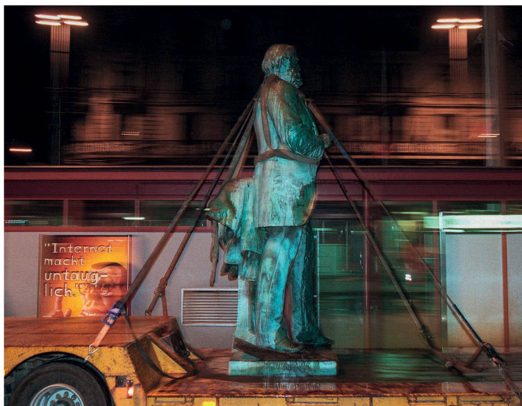
Mobiles Monument: Die Statue von Alfred Escher zügelt im Rahmen der Aktion Transit 1999 vom Zürcher Bahnhofplatz ins Industriequartier.

18 Wie Steine im Fluss der Zeit Ákos Moravánszky Warum gibt es Denkmäler und Mahnmale? Sind sie heute noch relevant?