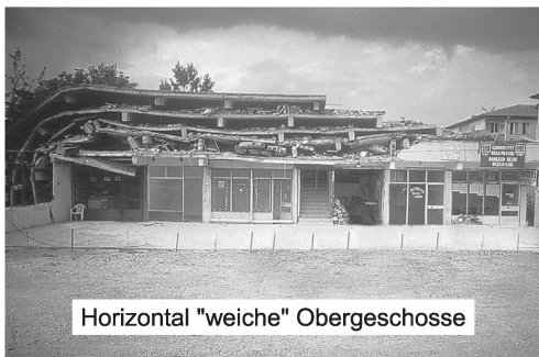
Horizontal "weiche" Obergeschosse