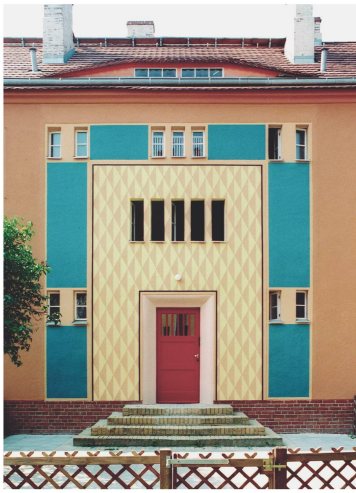
Die Gartenstadt Falkenberg von Bruno Taut, auch Tuschkastensiedlung genannt, liegt im Berliner Ortsteil Bohnsdorf.

eine Haltung, die sich mit dem zeitfremden Wort Demut umschreiben lässt. Entschädigt wird dieser Architekt mit jenen besonderen Momenten, in denen das ursprüngliche