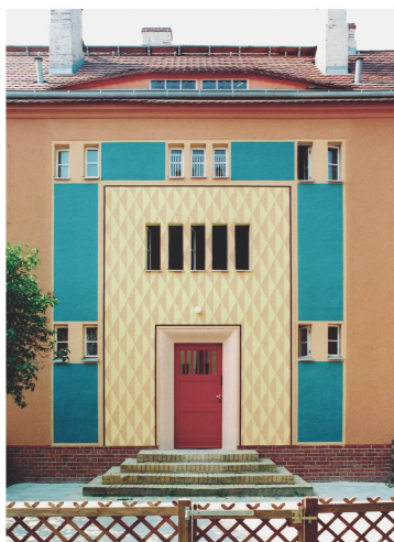
Die Gartenstadt Falkenberg von Bruno Taut, auch Tuschkastensiedlung genannt, liegt im Berliner Ortsteil Bohnsdorf.

eine Haltung, die sich mit dem zeitfremden Wort Demut umschreiben lässt. Entschädigt wird dieser Architekt mit jenen besonderen Momenten, in denen das ursprüngliche