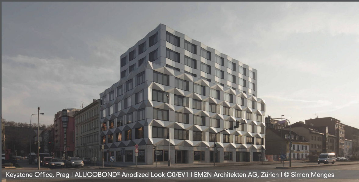
Keystone Office, Prag | ALUCOBOND® Anodized Look C0/EV1 | EM2N Architekten AG, Zürich

Inspirierende Oberflächen und außergewöhnliche Gestaltungsfreiheit.